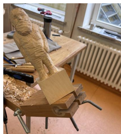
Zwei Bilder zeigen Arbeiten am Holz. Einmal wird eine Form angezeichnet, einmal zum Arbeiten befestigt.