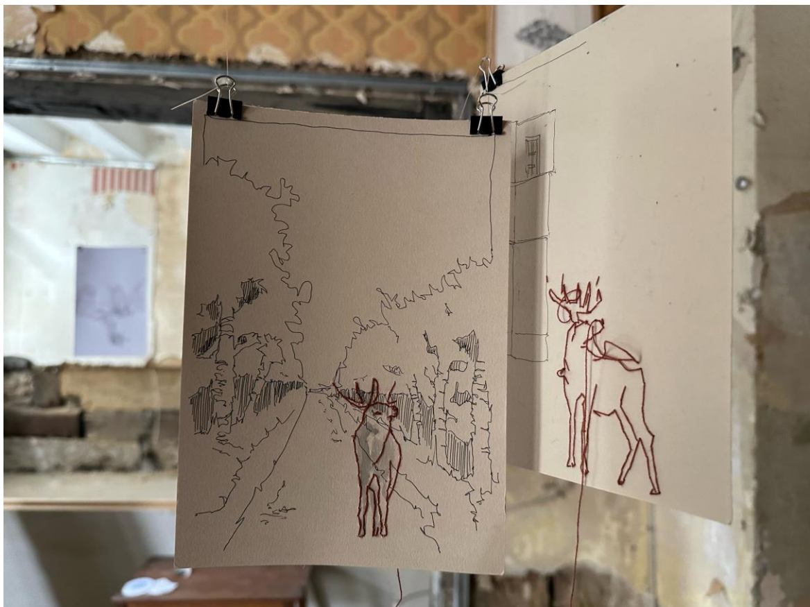
Das Bild zeigt eine Zeichnung mit Collage-Elementen von Janine Tüchsen.