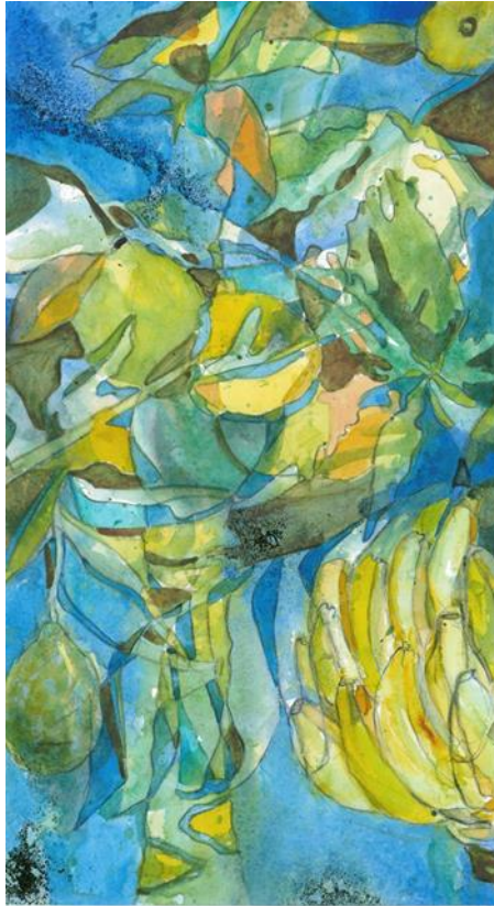
Aquarell auf Büten