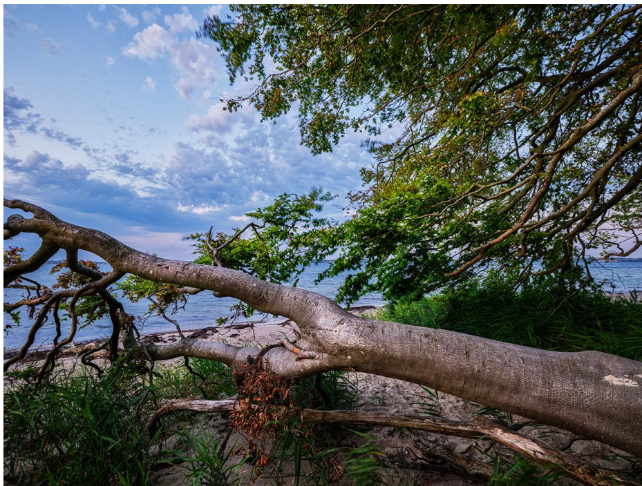
Das Bild zeigt eine Fotografie von Mark Robertz an der Flensburger Förde.