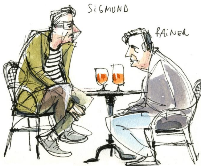
Sigmund und Rainer am Tisch beim Bier. Zeichnung von Nicola Maier-Reimer.

So erzeugen wir maximalen Ausdruck und Komik, und finden einen Weg, Menschen in Aktion zu zeichnen.