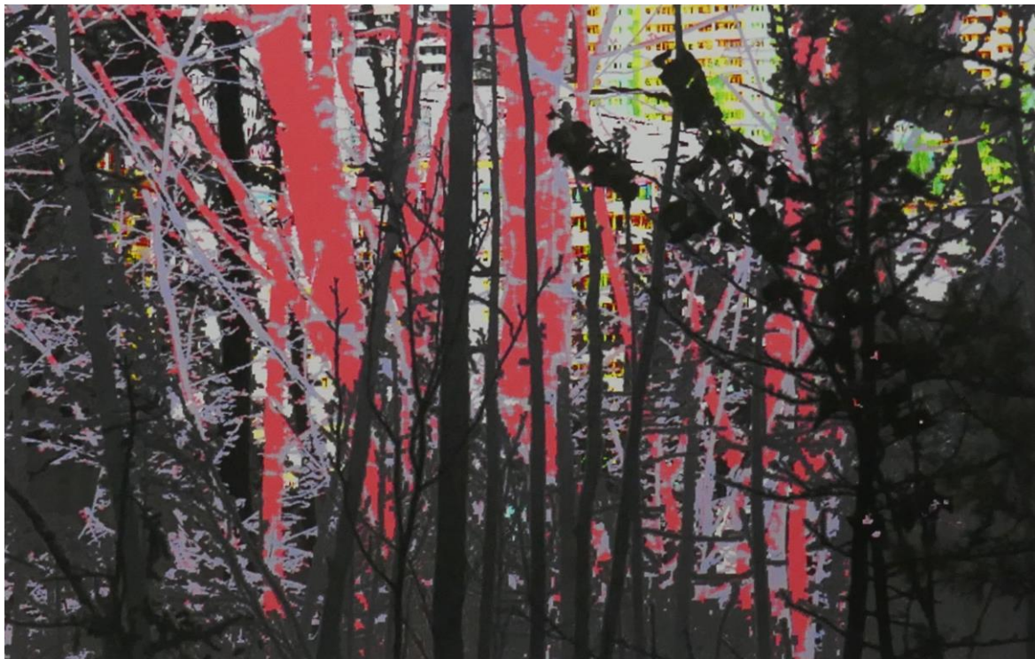
Das Bild zeigt ein Gemälde von Katharina Duwe: Siedlung am Waldrand II, 2024